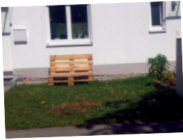
Vorher-Foto (falls möglich)